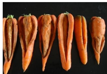
乾腐病による激しい裂開症状