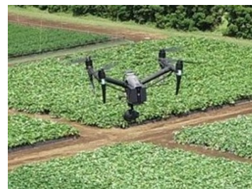
ドローンによる空撮

※新型コロナウイルス感染拡大防止の観点から、以下に該当する場合には入場制限を実施することになりますので、御留意ください。