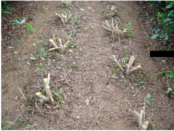
写真1 台切り時 (2012年5月31日)