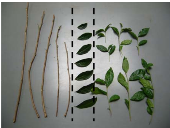
写真3 採取した新器官の分解試料 (左: 枝, 中央: 葉, 右: 新梢)

機で 70℃, 48 時間乾燥した。乾燥物の重量を測定した後, 更に, 105℃で 24 時間乾燥し, 新鮮物の乾物率を算出した。台切り部と地下部は十分水洗いして土壌を除去し, 風乾した後に新鮮重を測定し, 小型粉碎機カルイスカット (HNP-61, (株) カルイ製) を用いて粉碎した。粉碎物を通風乾燥機で 70℃, 48 時間乾燥し, 乾燥物の重量を測定した後, 放射性セシウムの分析に供した。なお, 部位別乾物重については 10a 当たりの乾物重に換算し, 株全体に対する割合としてそれぞれ乾物重構成比を算出した。