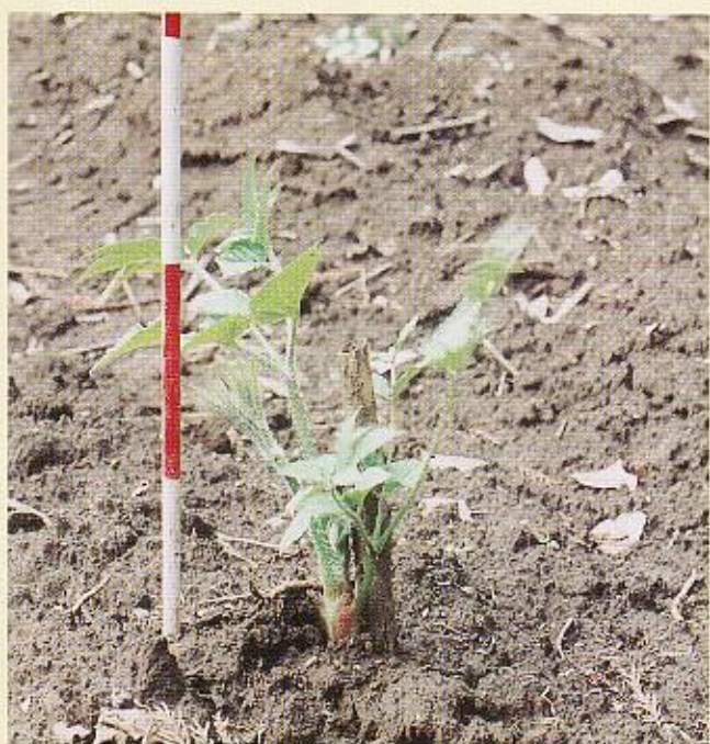
写真-5 畑における栽培状況