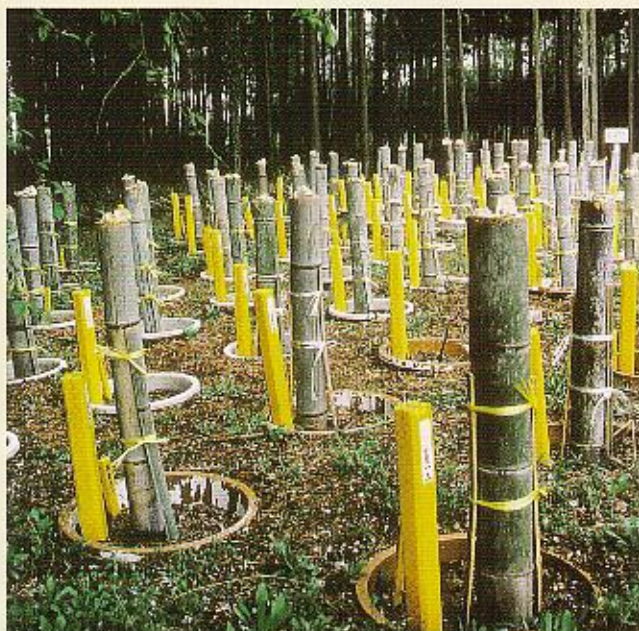
写真-1 竹筒を用いた軟化栽培状況