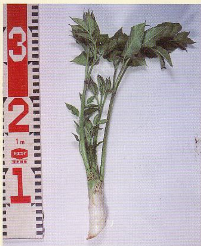
写真-6 軟化処理をしないで収穫