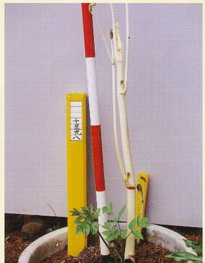
写真-2 軟化栽培をした選抜品種