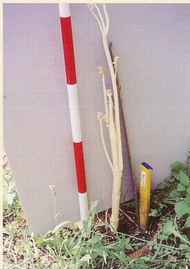
写真-4 軟化栽培をした在来種の愛知紫