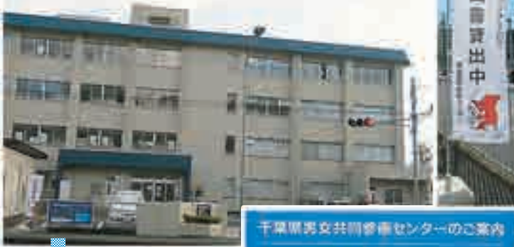
千葉県男女共同参画センター外観