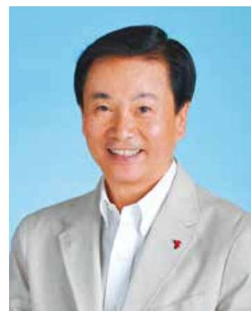
ちばアクアラインマラソン 実行委員会会長 千葉県知事 Governor of Chiba Prefecture