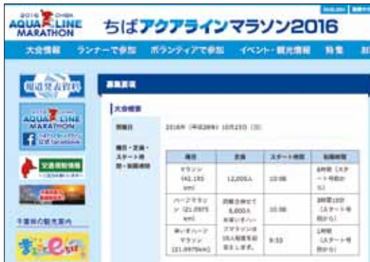
大会公式ホームページ