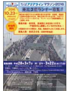
東北ランナーリーフレット