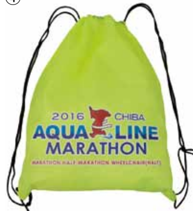
ナイロンランドリーバッグ