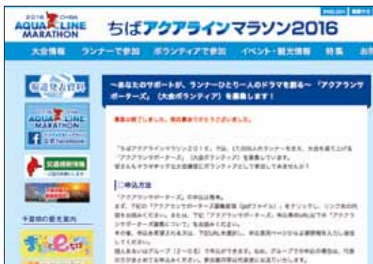
大会公式ホームページ