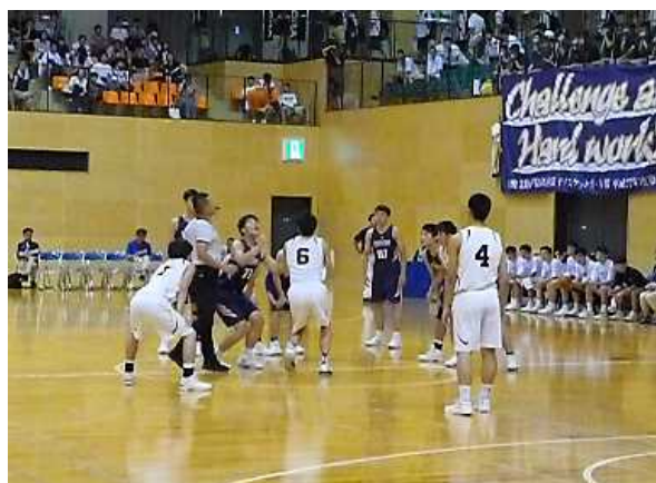
大会の様子（バスケットボール）