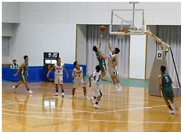
大会の様子（バスケットボール）