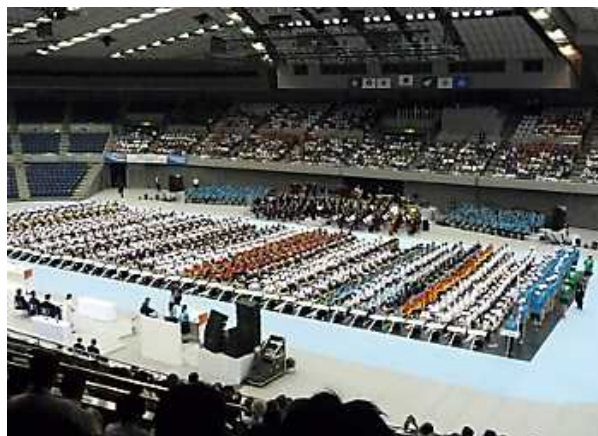
総合開会式（全体図）