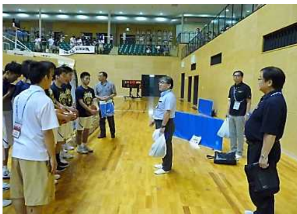
現地激励（バスケットボール）