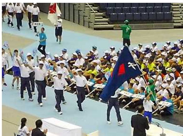
入場行進する千葉県選手団