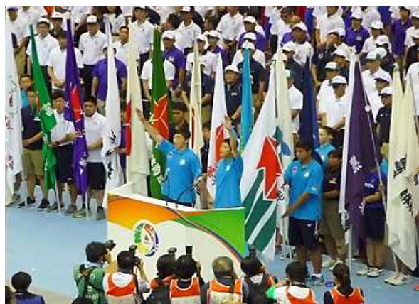
総合開会式での選手宣誓