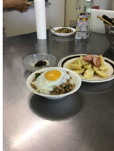
具体物による支援