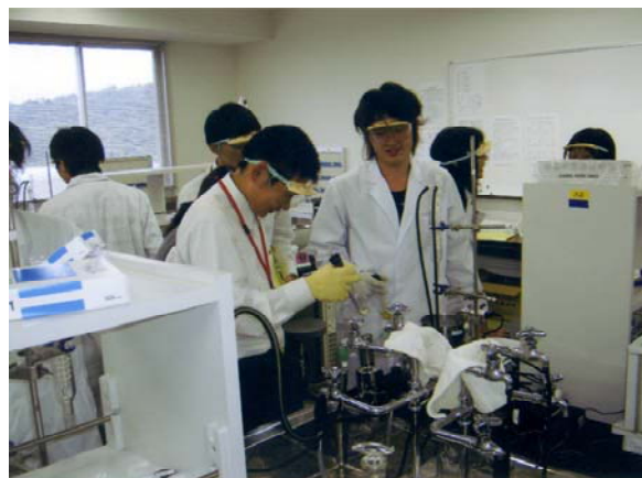
実験実習講座で学生のアドバイスを受ける 市立銚子高校生徒 (千葉科学大学)