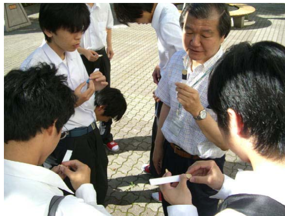
夏季特別講義で大学教員による飛行理論の 個別指導を受ける生徒 (県立市川工業高校)