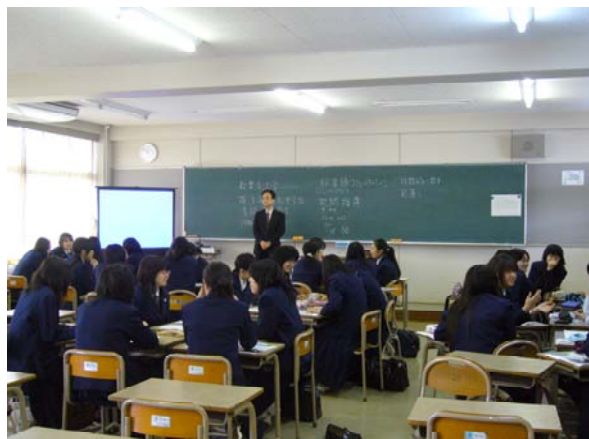
千葉大学教員による模擬授業での班別学習 (県立千葉女子高校)