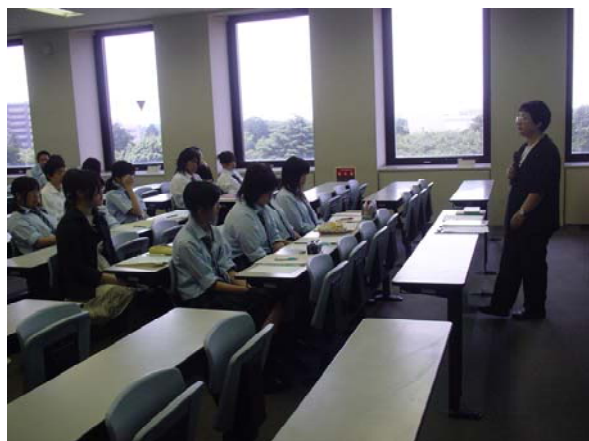
国際理解特別講座の講義の様子 (麗澤大学)