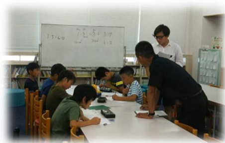
■塾の先生と少人数でじっくり勉強！

「塾に行きたい」でも「遠くて通えない」こんな状況が南房総市にはあります。そこで、夏休み中に5日間、2学期に12日間の学習講座を市内全小中学校で開催しています。小学校5・6年、中学校1～3年が対象。希望制ですが、7割強の子どもたちが参加しています。費用はテキスト代のみ。近隣の塾にお願いしながら、できるだけ少人数で学べるような環境整備に努めています。学習習慣の維持、基礎・基本の定着、苦手の克服等に生きています。