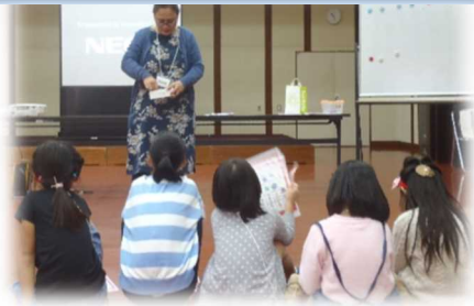
■英語ゲームに挑戦！

※「とみさとザ・ワールド・キッズ」では事業の実施を、富里市外国語推進事業実施協議会に委嘱しています。