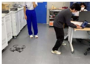
ドローン飛行の様子