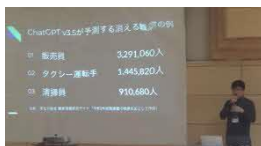
講義「未来の仕事～AIの今後等」