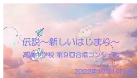
YouTube映像配信「合唱コンクール」