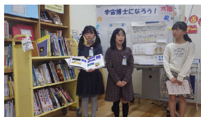
宇宙博士になろう！発表会