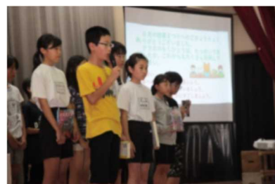
ブックトークライブ・パネルシアター