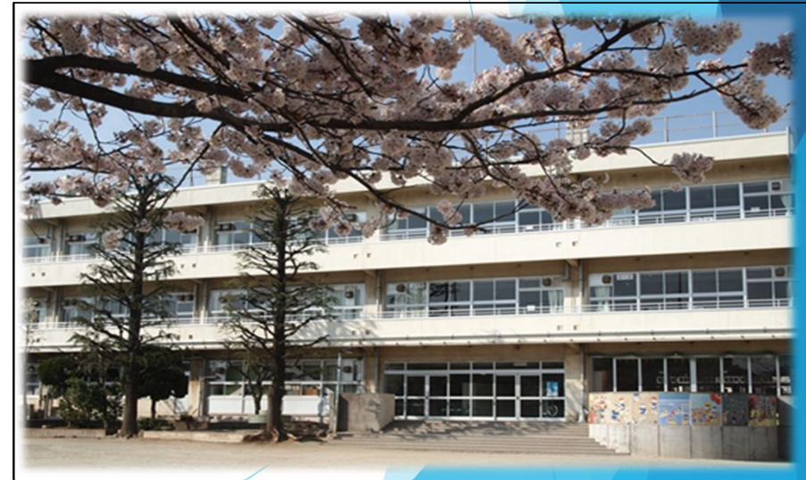
浦安市立浦安小学校