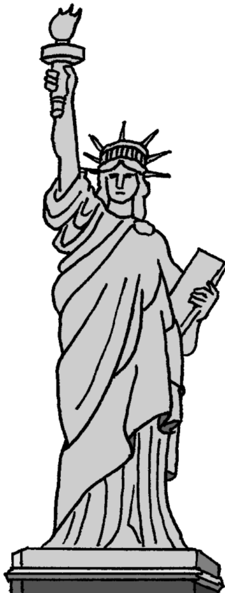
じゆう めがみ 自由の女神