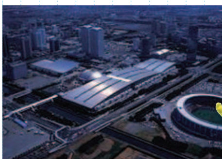
まくほり 幕張新都心 (千葉市)

県の面積は約 5,157 km 2 で全国第 28 位。(平成 24 年 10 月 1 日現在) 東京都と神奈川県をあわせたより大きく、現在 54 市町村があり、海岸線の長さは 534.3 km。(平成 24 年 3 月 31 日現在) 最も高い山は鴨川市と南房総市にまたがる愛宕山 あだごやま で 408.2m となっています。また、千葉県では、豊かな自然を保護するとともに、人と自然との共生を目指した県土づくりに取り組んでいます。