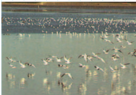
やつひがた ならしの 谷津干潟 (習志野市)

千葉県の温暖な気候と四季おりおりの豊かな自然の恵みは、住む人に安らぎを与えてくれます。