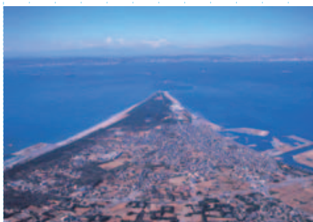
富津岬 県最西端の地 (富津市)