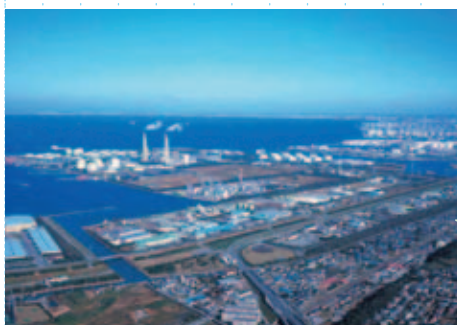
京葉工業地域 (市原市ほか)