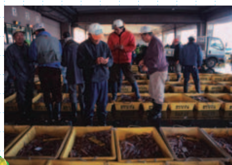
ちやうじ 銚子漁港 (銚子市)