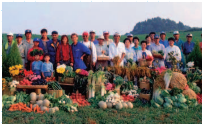
ちばの豊かな実り