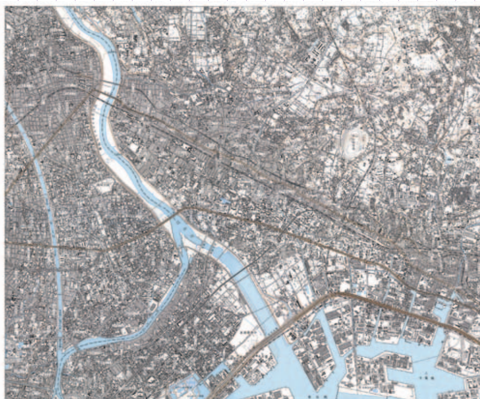
1998（平成10）年の船橋周辺の様子

（大日本帝国陸地測量部発行 二五、〇〇〇分の一地形図 船橋〔大正八年十一月三〇日発行〕）