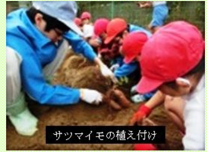
サツマイモの植え付け

農業系実業高校として地域から信頼されているとともに、地域と深い結びつきを有している学校です。地元との連携を第一に考え、子どもたちと「サツマイモの植え付け」や「動物ふれあい体験」などを行っています。