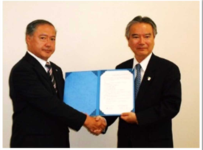
高大連携協定締結式 (聖徳大学)