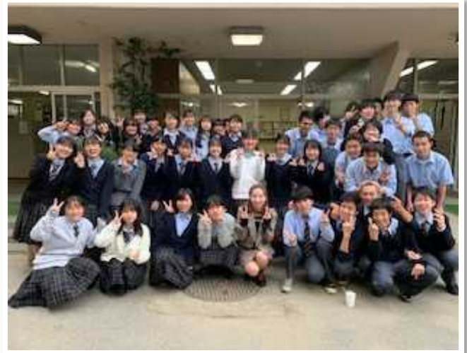
「留学生が先生」の様子