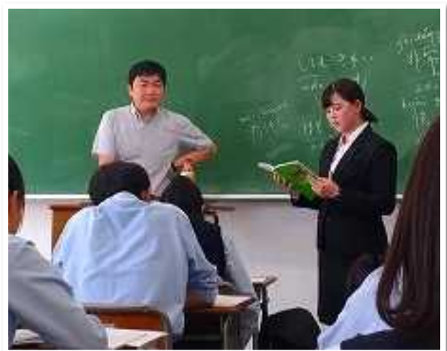
二松学舎大学学生によるインターンシップの様子