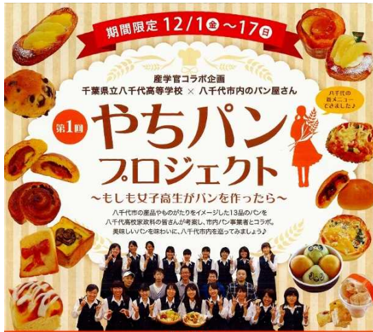
2017年度第1回ポスター

「やちパンプロジェクト」とは 家政科生徒が、八千代市内のパン職人とともに オリジナルパンを考案・販売するプロジェクト