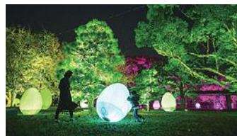
【展示予定】チームラボ《自立しつとも呼応する生命と呼応する木々》© チームラボ