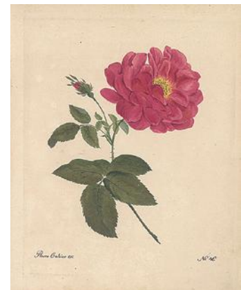
レーシッヒ 「バラ彩色図譜」 (1802-1820) No.46 ロサ・ガリカ・マクシマ