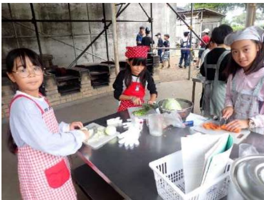
分担して調理します