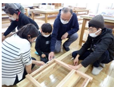
みんなで力を合わせて机をつくります

【申込アドレス】 https://kimikame.net/event/event?id=12215022