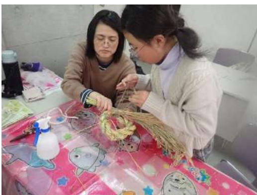
親子で触れ合う時間になります