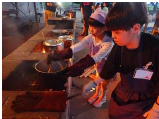
協力する作業では助け合いの心を培います