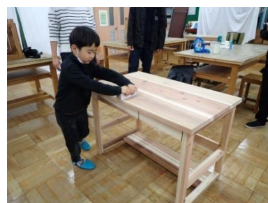
モノを大切にする心を育みます