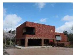
風土記の丘資料館