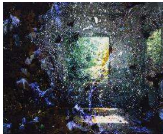
清水裕貴《浮上<沖ノ島の隆起地層>》2024 年 ©Yuki Shimizu

会 期 令和8年年1月18日（日）まで開催中 会 場 県立美術館 開館時間 9：00－16：30（入館は16：00まで） 休 館 日 月曜日、12/28（日）-1/4（日）、1/13（火） （但し1/12（月）は開館） 入 館 料 一般1,000円（800円）、高校・大学生 500円（400円）、 ＊（ ）内は20名様以上の団体料金 ＊中学生以下、64歳以上、障害者手帳等をお持ちの方とその介護者1名は無料 ＜関連イベント＞