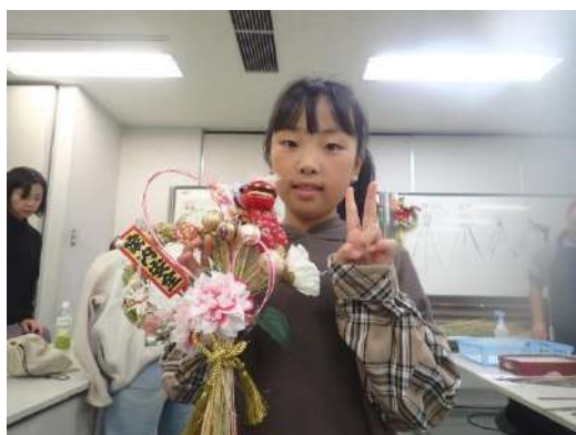
上手にできたらお正月に飾りましょう