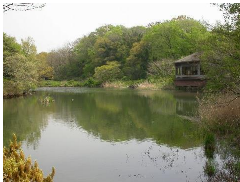
生態園の舟田池と野鳥観察舎

本展では、この森を造り、35 年にわたって守り、育て、調べ続けてきた研究員たちの活動とその成果を、標本や写真、調査風景の再現ジオラマ、研究員の等身大パネル等で楽しく紹介します。観察会やミュージアムトークなど、イベントも盛りだくさんです。