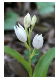
クゲヌマラン (絶滅危惧種)