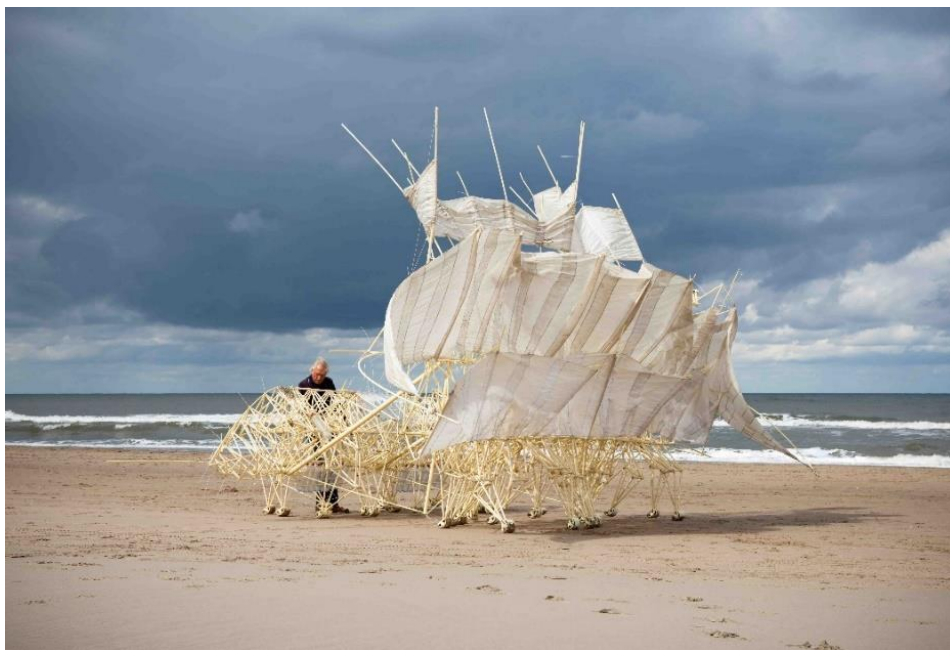
《アニマリス・ブラウデンス・ヴェーラ》2013年 ©Theo Jansen

千葉県誕生から150周年を迎える今年、県立美術館では、本県とゆかりの深いオランダとの文化交流事業として、オランダ出身の世界的アーティスト テオ・ヤンセンの展覧会を開催します。