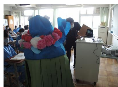
周防大島のキャラクターも登場