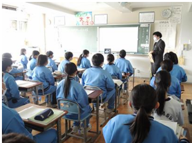
授業のねらいを確認

浦安市教育ビジョンの目指す子ども像の1つとして、「人や社会との積極的な関わりを通して、多様な人や文化に対する理解を深めること」があります。本校では、2年生の社会科の授業で取り扱った内容の発展的な学習として、中国・四国地方の過疎等の社会的課題を解決するための「地域おこし」についてアイデアをまとめ、オンラインで山口県周防大島町立周防大島中学校の生徒に発表を行いました。周防大島中学校の生徒からも感想がとどき、交流を通してお互いの地域についての理解を深めました。