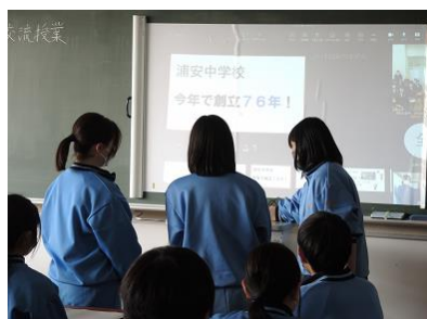
お互いの学校紹介