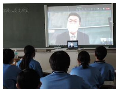
周防大島町役場の方から実際の施策についての説明

「郷土に対する想い」はどの地域でも共通していることを理解し、本校の生徒にとっても「ふるさとうらやす」の今や未来について考える貴重な機会となりました。