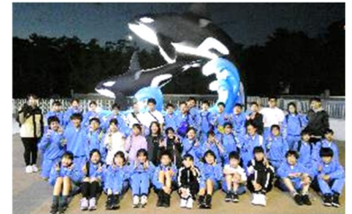
【オリエンテーション合宿】