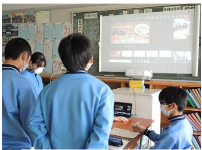
浦安中学校の発表を聞き、周防大島中学校生徒が感想を述べ、意見交流を行いました。