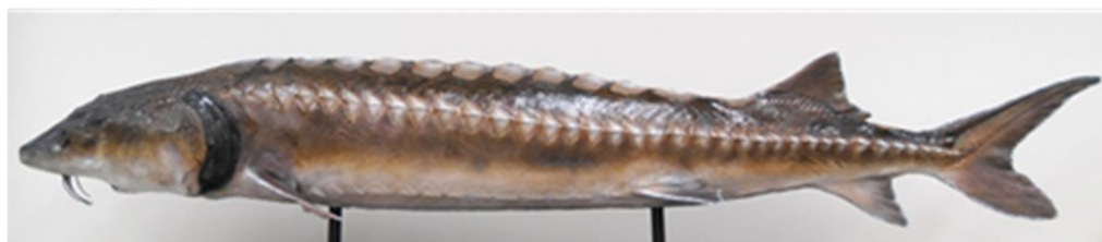
千葉県での発見は1例のみの「珍魚」、「カラチョウザメ」（全長約2m）の剥製