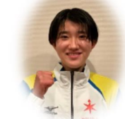
ジャイアントスラローム