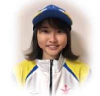
クロスカントリー