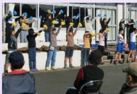
大平台フェスティバルの様子