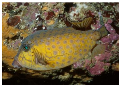
よく見られる「ふつうの魚」 「ハコフグ」は最近になって肝に毒があることが明らかになった

房総の多種・多様な魚を標本や映像で紹介し、人とのかかわりや地球温暖化など環境の変化について考えます。