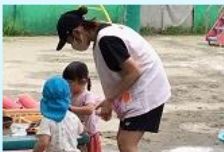
保育園ボランティア実習の様子