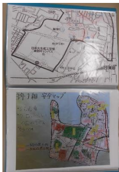
黒田 みのり 教諭