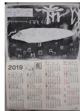
山中 宣史 教諭