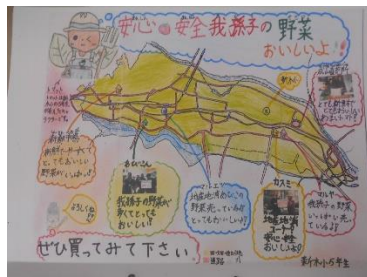
杉本 一生 教諭