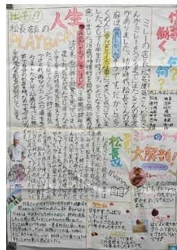
菅沼 得理香 教諭