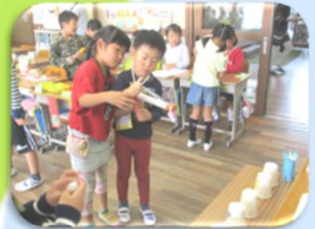
小学校の活動の様子