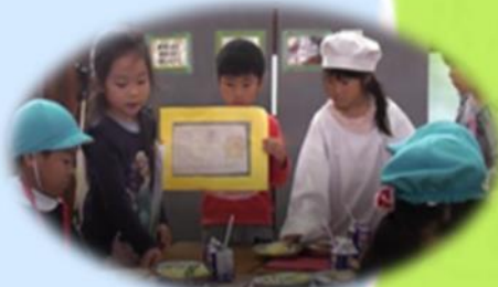
小学校での交流の様子