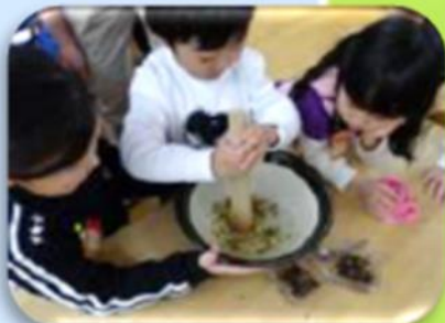
幼稚園等の活動の様子