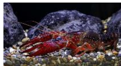
緊急対策外来種アメリカザリガニ

会 期：2月9日（土）～5月6日（月・振休） 開館時間：9時～16時30分 ※入場は16時まで 入 場 料：一般200円、高大生100円、 中学生以下・65歳以上無料