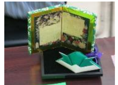
「五月飾りをつくろう」