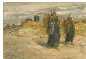
浅井忠《漁婦》 (千葉県指定有形文化財) 1897年、千葉県立美術館蔵

第10回となる今回のテーマは浅井の洋画です。明治維新以後、日本でも制作されるようになった油彩画や水彩画は「洋画」と呼ばれました。洋画の研鑽と普及に努めた浅井忠の仕事を、作家の代表作であり先頃千葉県指定有形文化財〔絵画〕となった《藁屋根》や《漁婦》、フランス滞在中に描いた《農婦》などの人物画をとおして紹介します。