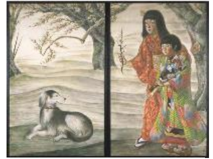
椿貞雄《春夏秋冬四屏風(春)》 1931年、千葉県立美術館蔵

日本画・洋画・工芸・書で構成する展覧会です。その作品を屏風仕立てにした理由、屏風の形態にすることで得られた効果は何か。屏風の構造が生み出す物語の進行、季節の移り変わり、視点による見え方の変化など、作家の意図とその効果、屏風の楽しみ方について考えます。