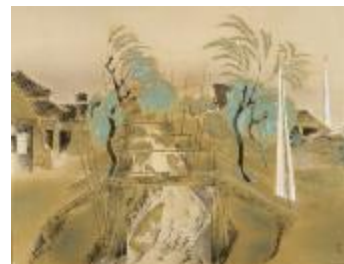
富取風堂《葛西風景》 1937年、千葉県立美術館蔵

当館の所蔵品から富取風堂(1892-1983)の作品を展示します。富取は、初期は速水御舟らと活動し、市川に居住し、院展などを舞台に作品を発表しました。花鳥や風景の優れた作品や素描を通してその画業を辿ります。