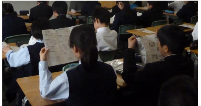
利用案内のパンフレットを見ながら説明を受ける生徒