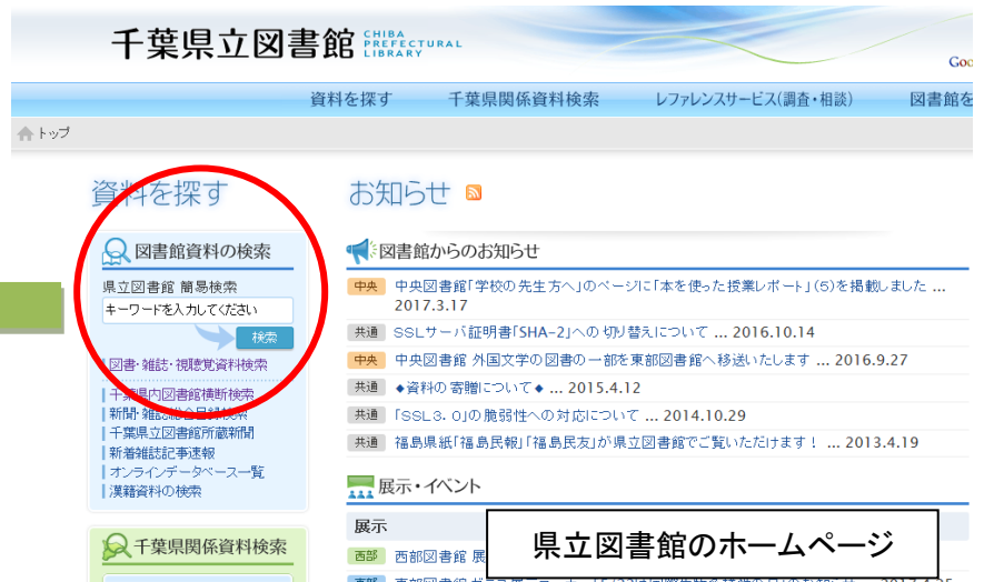
県立図書館のホームページ

書名や著者名だけでなく、調べたいテーマで資料を探せるようになると、とても便利です。「テーマ(件名)で探す」のは県立図書館以外の図書館でも使える手法なので、身近な図書館で調べ学習をする時にも役に立ちます。ぜひ覚えて使っていただきたいです。「図書を探す」方法は、県立図書館のホームページ内、調べ案内(パスファインダー)のページにも詳しい方法が載っています。中学生だけでなく大人の方もぜひご活用ください。