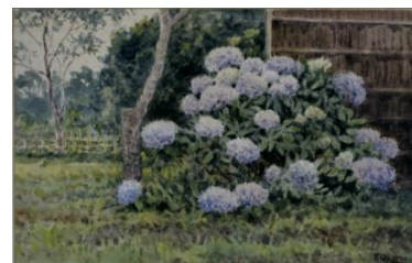
大下藤次郎《紫陽花》