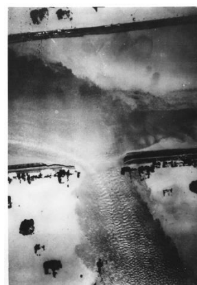
カスリーン台風による利根川破堤の写真