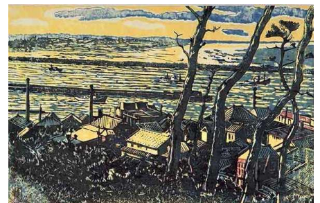
金子周次《川口風景》