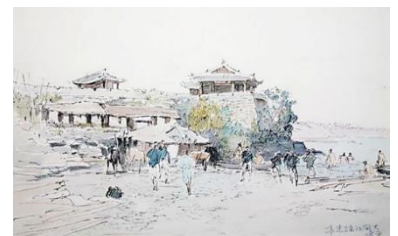
浅井忠《平壤大同江煉光亭》