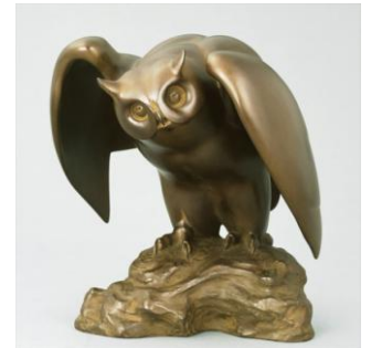
津田 信夫 《北辺夜猫子》