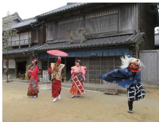
チンドン獅子舞（大道芸）