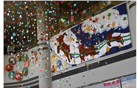
昨年度のクリスマス装飾の様子