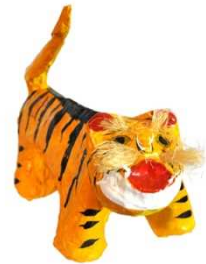
佐原張り子 (県立中央博物館大利根分館所蔵)