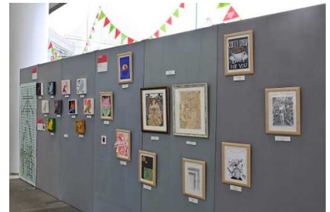
昨年度の作品展の様子