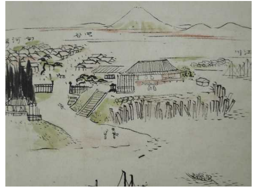
『関宿土産』（千葉県立中央図書館蔵）

関宿は江戸に近く、利根川と江戸川の分流地点にあり日光東往還が城下を通過することから水陸交通の要衝でした。そのため江戸幕府から重視され、江戸川沿いに関所が置かれました。今回の展示では新公開の史料も用いて、関所の場所や構造、勤務の実態などについて、関宿関所を中心に紹介します。