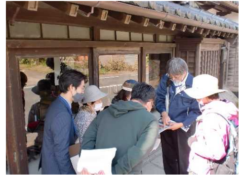
街並み探検の様子