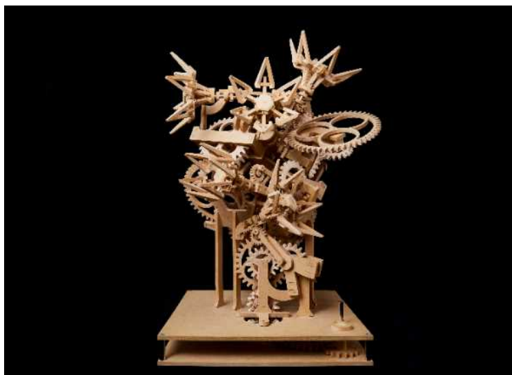
すすきかんご 鈴木完吾『秩序ある無秩序』 すがわらこうた 撮影：菅原康太