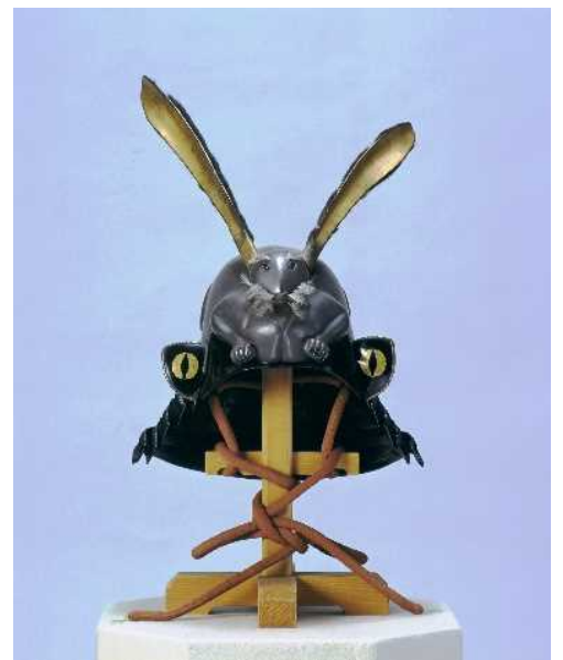
うさぎなりかぶと 兔形兜