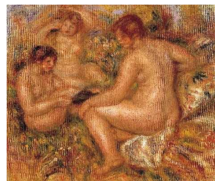
ルノワール『三人の浴女』 埼玉県立近代美術館蔵