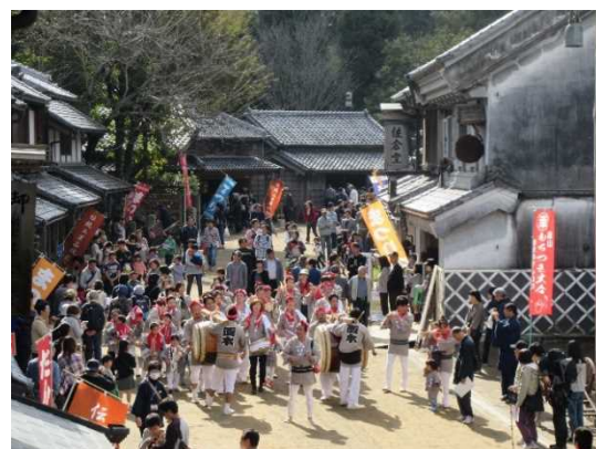
房総のむら内での民俗芸能の上演の様子