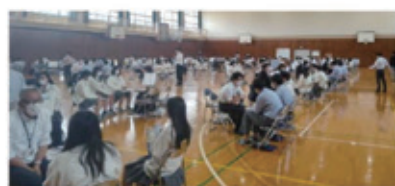
進路ガイダンスの様子

1年生から、ガイダンスなどを通じて、自分の個性や適性を探究するとともに、進路先について深く学ぶことで、自分の目標を確かなものにし、進路実現に向けて準備をしていきます。