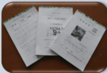
レポート (報告課題)