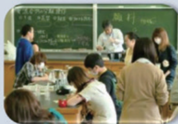
スクーリング (面接指導)