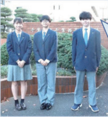
私たちが西高を紹介します