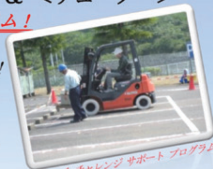
マルチ チャレンジ サポート プログラム