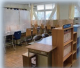
【進路資料室の自習ブース】

真面目で素直な磯辺高校の生徒だからこそ、落ち着いた学びの環境が自然と作り出されます。授業では、講義形式だけではなく、グループワークやプレゼンテーションを取り入れた生徒主体の活動を展開します。