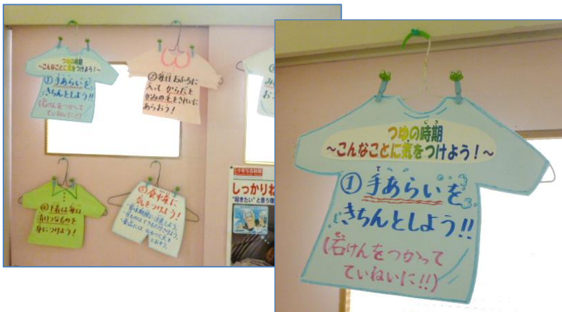
身近な物（針金ハンガー）を使った掲示物。子どもたちの目につきやすいような工夫（色・形）がされています。