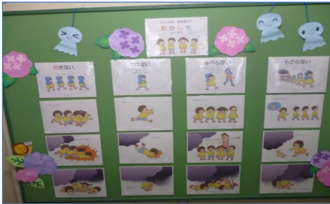
幼稚園に掲示されていた「避難の仕方」です。『お・か・し・も』がイラストとともに分かりやすく示されています。

第1号では、特別支援教育の視点から教室環境・授業づくりをご紹介しました。第2号は不登校対策についてでした。本号では、7月までの計画訪問を通して見られた、参考になる「掲示物&コーナーの工夫」をご紹介します。2ページ目には、「落ち着きと温かさのある教室環境づくりのためのチェックリスト」を掲載しました。基本的な内容ですが、つい忘れがちなことでもあります。今一度、チェックをしてみませんか？