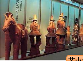
芝山古墳・はにわ博物館