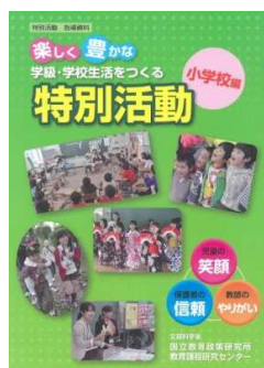
「楽しく豊かな学級・学校生活をつくる特別活動（小学校編）」 教員向け指導資料