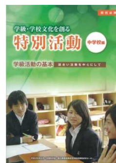
「学級・学校文化を創る特別活動（中学校編）」 教員向けリーフレット