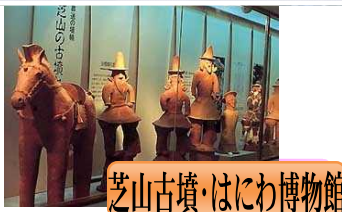
芝山古墳・はにわ博物館