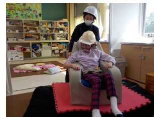
「倒れないように体に力を入れる」

地震の際に自分の体を支えることができるように、ゆれを感じたら体に力を入れる学習に取り組んだ。