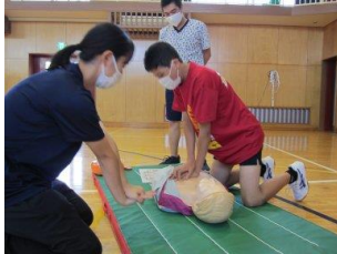
「訓練人形を使った実技研修」