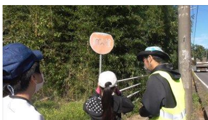
「学校の周りの防災施設調べ」