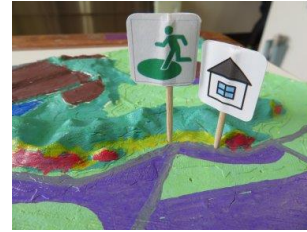
「地形と災害の起きやすさの関係を考える」