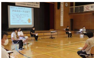
防災ゲーム「クロスロード」

内容：拠点校の防災教育の取組紹介、防災ゲームクロスロード、講演会 参加者・参加人数：県教育委員会1名、匝瑳市総務課1名、拠点校学校運営協議会9名、飯高地区自主防災会4名、地域住民1名、拠点校保護者3名、拠点校教職員、大学教授 感染予防対策：運営担当以外の拠点校教職員は、校舎にて学部ごとにリモート会議システムでの参加とし、会場に入る人数を極力減らした。