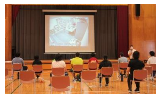
講義「あなたにできること」