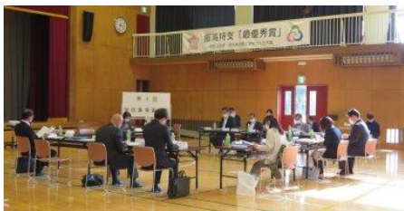
「第1回学校運営協議会」