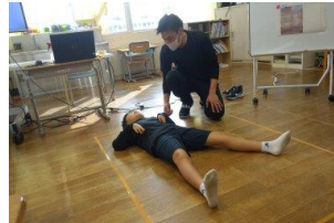
「床に直接寝たときと比べてみる」