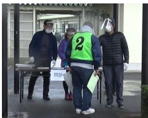
「避難者の受け付け訓練」

参加者・人数：飯高地区自主防災会 14名、拠点校学校運営協議会 9名、拠点校保護者 3名、県教育委員会 1名、匝瑳市総務課 1名、拠点校児童・生徒、拠点校教職員、大学教授、学校関係（他校参観者）10名