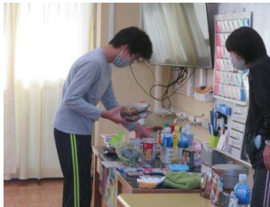
「実物を手にとって防災用品を選ぶ」

災害に備えて、防災リュックに何を入れたら良いか考えた。なぜ必要なのか、どんなときに使うのか、実物を手にとって確かめながら話し合った。