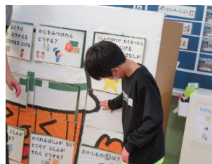
「防災ビンゴで振り返り」