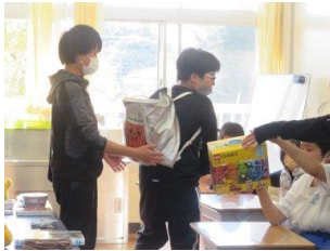
「リュックに入れて重さを確かめる」