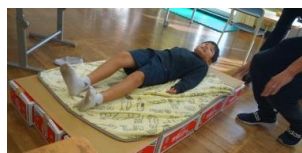
「段ボールベッドに寝てみる」

段ボールベッドやペットボトルランタンを体験し、なぜ災害の際に必要なものか考えた。また、非常持ち出し袋には何が入っているのか確認した。