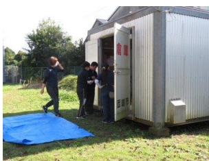
「防災倉庫の中には何が入っているか」

校庭の防災倉庫には何が入っているのか中に入って調べた。また、地域の防災施設にはどんなものがあるのか、実際に学校の周りを歩いて調べた。