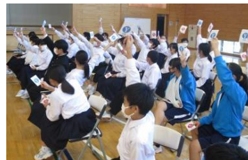
「防災ゲーム：カードで意思表示」

拠点校の教員3名が、モデル地域の中学校の1年生を対象に、拠点校の防災の取組の紹介、防災ゲーム「クロスロード」、障害についての講義の出前授業を行った。防災ゲームでは、選択肢を選んだ理由を積極的に発表し合うことで、答えは1つではないことに気付くとともに、災害発生時の心の葛藤を疑似体験することができた。障害についての講義では、障害とはどういうことなのか、自分にできることは何なのかを考える機会となった。