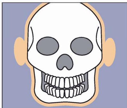
あごの骨の模型図