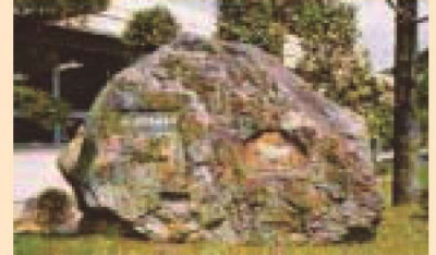
日本らく農発しょうの地記念碑があります。

今では全国に「酪農」が広まり、千葉県は牛乳の生産量全国第3位です。（平成22年現在）