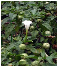
チョウセン アサガオの葉と花