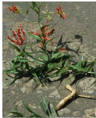
地下部 を付けた グロリオサ 全体