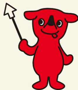
千葉県マスコットキャラクター チーパくん