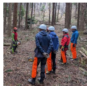
実地講習会 (※イメージ)