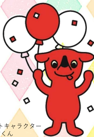
千葉県マスコットキャラクター チーバくん