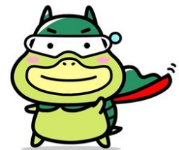
キャラクター 「たしかめたん」

事業主の皆様におかれましても、この機会にアルバイトの労働条件の確保や適正な労務管理等につきまして、再度ご確認ください。