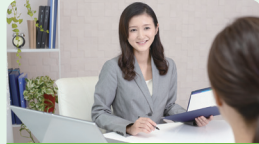
カウンセリングブース