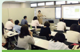
再就職支援セミナー

就職活動のスキルのセミナーや、中高年・女性向けセミナー、企業との交流会を実施しています。