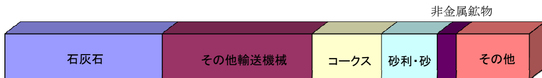
■移入貨物主要品種別表