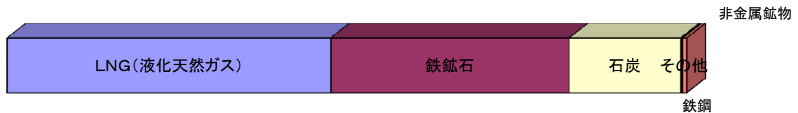
■輸入貨物主要品種別表